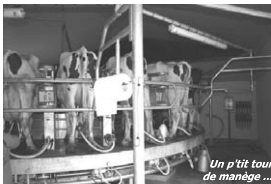
Un p'tit tour de manège ...