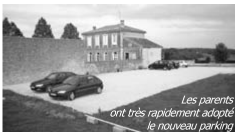
Les parents ont très rapidement adopté le nouveau parking

Il répond à plusieurs objectifs. Tout d'abord, il s'inscrit dans une possible évolution de développement immobilier. De plus, il satisfait pleinement les parents d'élèves qui amènent ainsi leurs enfants dans une zone sécurisée directement à la garderie.