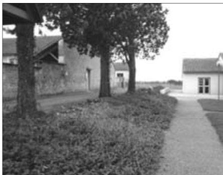
La haie, devenue envahissante, a été taillée à ras pour qu'elle redémarre harmonieusement. Les deux arbres du fond ont été supprimés

La haie séparant la rue de l'école et la place de la mairie sera taillée.