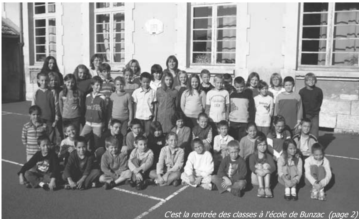
C'est la rentrée des classes à l'école de Bunzac (page 2)