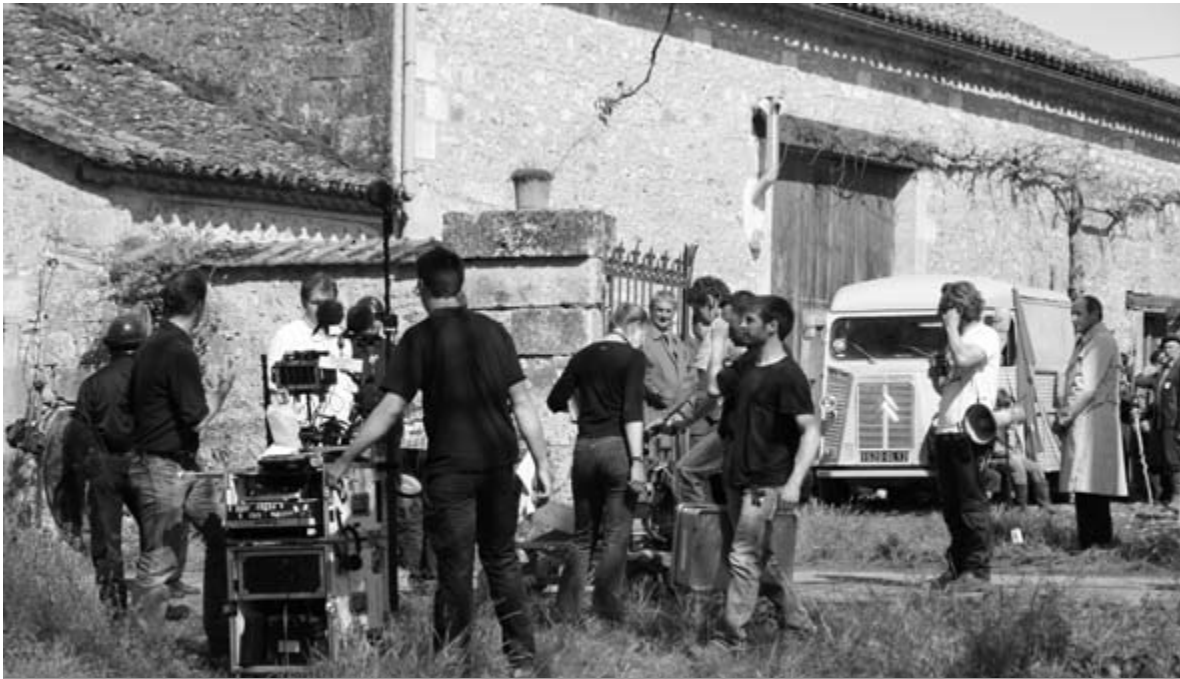
Arte et Canal + tournent une séquence du film "L'école du pouvoir" à la ferme des "Denis" (page 2)