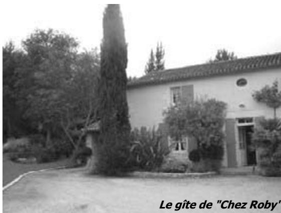
Le gîte de "Chez Roby"

La Charente compte aujourd'hui plus de 450 gîtes ruraux; ces logements sont contrôlés par le Relais Départemental et classés par épi (gîte de France) ou par clés (clévacances) selon leur degré de confort et leur environnement. (suite page 4)