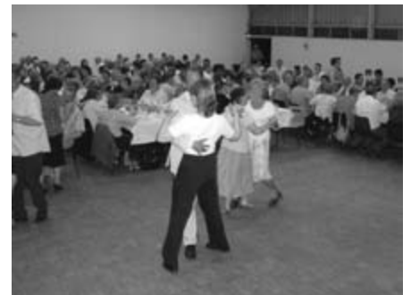
soirée de réjouissance à l'occasion du 30 ème anniversaire du Comité de jumelage

tions festives se sont succédées. Rendez-vous est pris pour les 5, 6 et 7 septembre pour commémorer cet anniversaire à Birkenau.